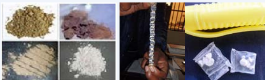
Madaraja ya heroin