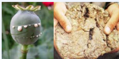
Utomvu wa afyuni (opium)