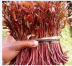
Mafungu ya Mirungi