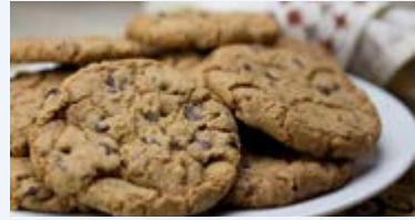
Biskuti zilizotengenezwa kwa bangi