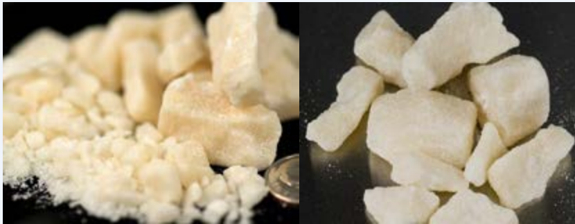
Cocaine ya mawe 'crack'