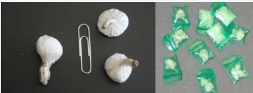
Kete za cocaine