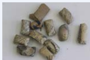
Kete za bangi