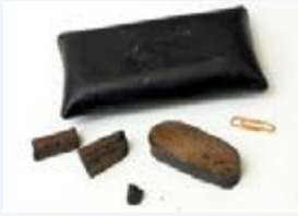
Bangi iliyosindikwa (hashish)