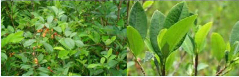
Majani ya mmea wa Coca