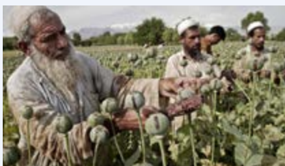
Utomvu ukivunwa kwenye mimea ya afyuni

Heroin ni aina ya dawa ya kulevya inayotengenezwa na kemikali inayoitwa ‘morphine’ ambayo hupatikana kwenye utomvu ‘opium’ wa tunda la mmea wa afyuni ‘opium poppy’ unaolimwa zaidi kwenye nchi ya Afghanistan na kwa kiasi kidogo Myanmar na Laos. Hapa nchini, heroin inashika nafasi ya pili kwa matumizi baada ya bangi na hutumiwa zaidi kwa njia ya kuvuta ikiwa imechanganywa na kiasi kidogo cha bangi na sigara (teli au cocktail). Heroin ni dawa ya kulevya inayoongoza duniani kwa kusababisha uraibu kwa haraka, vifo vinavyotokana na kuzidisha kiasi cha matumizi au maradhi mbalimbali. Pia, ni dawa ambayo ina watumiaji wengi wanaohitaji tiba. Heroin hujulikana kwa majina ya mtaani kama unga, ngada, teli (cocktail), msharafu, white, kijiwe, mdude na brown.