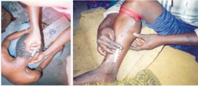
Wajidunga wa dawa za kulevya