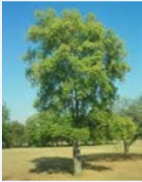
Mti wa Mrungi

pamoja na Rasi ya Arabuni nchini Yemen. Mirungi hutumiwa zaidi kwenye mikusanyiko ya wanaume ingawa katika miaka ya karibuni wanawake wamejiingiza katika matumizi ya dawa hiyo. Hapa nchini mirungi hustawi na hupatikana kwa wingi katika eneo la kanda ya Kaskazini; Same, Lushoto, Babati, na Mlima Meru. Kiasi kikubwa cha mirungi huingizwa nchini isivyo halali kutoka nchi jirani za Kenya na Ethiopia. Mirungi hufahamika kwa majina mengine kama gomba, veve, miraa, mogoka, kangeta, giza, bomba, kashamba, mbaga na alenle.