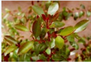
Tawi la Mrungi