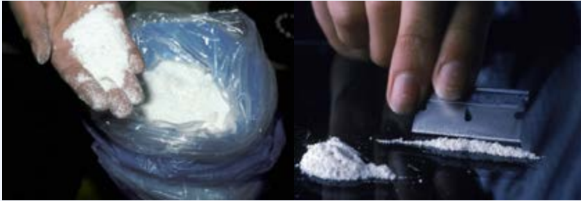
Cocaine ya unga