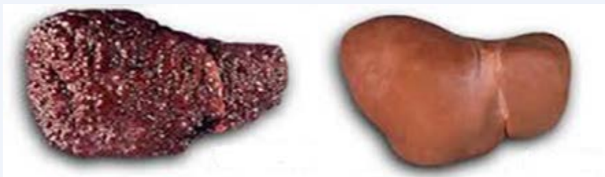
Maini yaliyoathiriwa na pombe (kushoto) yakilinganishwa na yasiyoathiriwa

Huchochea uhalifu: Ulevi utamlazimisha mtu kutafuta njia rahisi za kupata pesa za kunulia pombe. Kwanza ataanza kwa kutumia akiba yake yote na ya familia, baada ya hapo ataanza kuomba mkopo kutoka kwa jamaa na marafiki na baadaye ataanza kuiba na kupokea pesa kwa njia zingine za uhalifu.