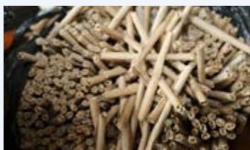
Misokoto ya bangi

Kiasi cha THC kimekuwa kikiongezeka kutokana na kukua kwa teknolojia katika uzalishaji wa bangi. Aidha, kemikali ya THC hukaa mwilini mwa mtumiaji kwa muda mrefu hadi mwezi mmoja kwa kujishikiza kwenye kuta za seli za neva za ubongo (neurons) ikilinganishwa na aina nyingine ya dawa za kulevya.