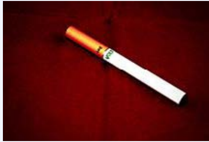
Sigara za kielektroniki

Mwezeshaji atoe tahadhari ya hatari ya tabia ya uvutaji sigara inavyoweza kuchangia katika kujiingiza kwenye uvutaji bangi na dawa nyingine za kulevya na kuathiri zaidi afya ya mvutaji.